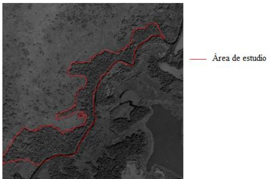
Figura 2. Fotografía aérea del fragmento de bosque (Tomado y modificado de Urbina 2010)

En este sitio se encuentran tres grupos identificados de C. albifrons versicolor (CA1, CA2 y CA3). El fragmento ha sido mapeado y se han trazado senderos que facilitan el acceso a los lugares por donde se desplaza la subespecie. Cada sendero tiene puntos de referencia marcados con cinta flagging naranja cada 25 metros lo cual facilitó la buena calidad de los seguimientos. Los muestreos se realizaron desde las 6:00 hasta las 18:00.