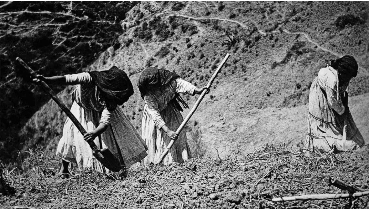
Juan Rulfo Mujeres mixes trabajando , 1956