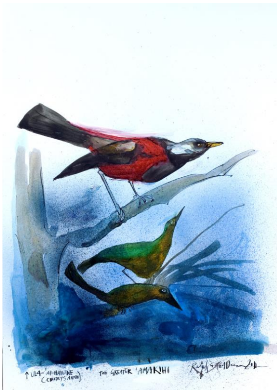
Ralph Steadman, Two Greater Amakihi , 2011