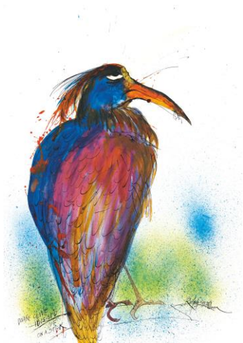
Ralph Steadman, Dwarf Olive Blissed Off on a Stick , 2011.

En 2012, Ralph Steadman y Ceri Levy publicaron el libro Extinct Boids (Levy y Steadman 2012), proyecto que consiste de 100 pinturas de aves extintas que realizó Steadman con el motivo de la exposición que al comienzo de este capítulo he mencionado: Ghost of Gone Birds . Esos cuadros proponen una poética que promueve una conciencia de la extinción de las aves como problema contemporáneo nuclear.