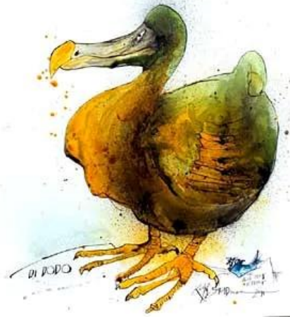
Dodo , Ralph Steadman, 2011.

Dentro de las artes plásticas y la literatura contemporánea hay una atención particular al animal como problema ecológico y político, como cuerpo acaparado por el biopoder. Tal como afirma Giorgi en su libro Formas comunes: animalidad, cultura y biopolítica (2014), “el animal cambia de lugar en los repertorios de la cultura” 132 . Desde los años setenta, hay obras en la tradición latinoamericana en las que el animal ya no es lugar de una otredad determinada por una inferioridad inmanente, sino es potencia afectiva que el ser humano reconoce como propia. De este modo, la nueva proximidad propuesta por Giorgi habla de umbrales donde, al poner en juego al animal, se pone en juego la perspectiva que sobre él tiene el ser humano, y que sin lugar a dudas ha sido predominantemente antropocéntrica, para dar lugar a una mirada más ecocéntrica.