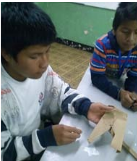
13. Autor Estudiantes Del Proyecto Moda y Creatividad con Estilo

La valoración de la experiencia artística para el desarrollo de sentimientos morales que propicien la construcción de una convivencia armónica en la institución