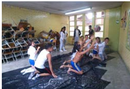
2. Autor: Estudiantes Del Proyecto Sport and Dance

En la praxis de la teoría, en el proyecto realizado por la Institución Educativa Sorrento, las docentes del énfasis de ciencias humanas, desde el inicio, en su propuesta buscaron a través de la Investigación Acción participativa,