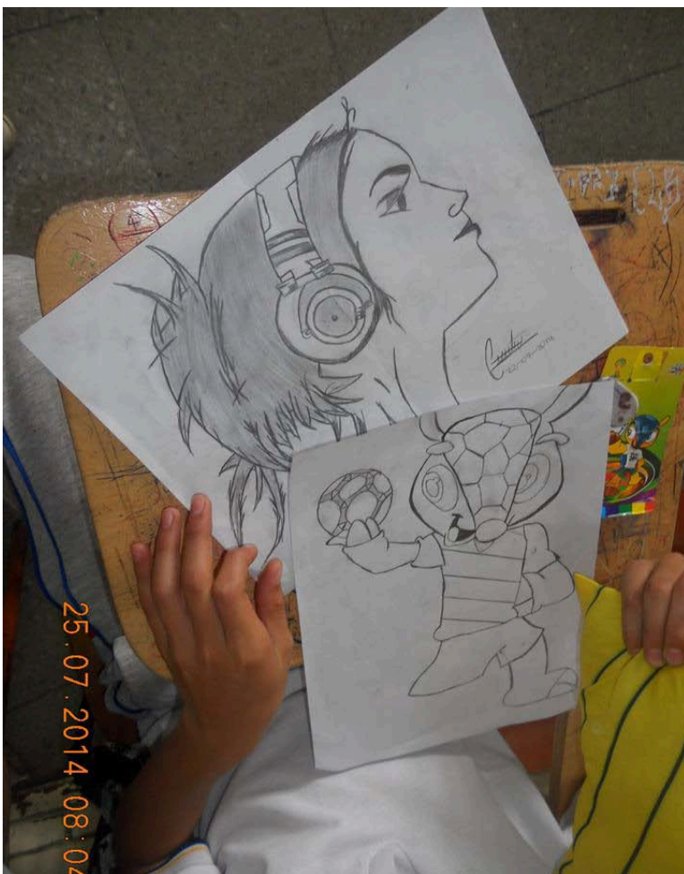
9. Autor: Estudiantes Proyecto Diseña tu Manualidad con Estilo

“Ya no hay esas peleas a toda hora, que en descansos, en los cursos, en los parques, no faltaran, pero supongo que han bajado” Entrevista a Docentes