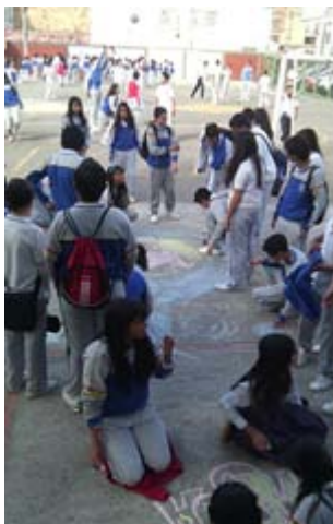
7. Autor: Estudiantes Del Proyecto Construyendo una Imginación Creativa, Publicidad y fotografía

de diferentes grados y entre los estudiantes y profesores, fomentando relaciones basadas en el respeto y la valoración y no en el poder, “Este proyecto es una gran experiencia, porque le podemos enseñar a los chicos, lo que ellos quieren aprender y de igual forma también nosotros aprender algo nuevo cada día de intervención, ya sea algo relacionado con los muchachos o el trabajo en grupo de debemos realizar” Taller de Escritura, grado undécimo. Además promueve el aprendizaje cooperativo, pues la estrategia utilizada es la de “estudiantes aprendiendo de estudiantes” donde los niños, niñas y jóvenes con talentos e intereses en la música, la danza, las manualidades, la fotografía, la moda, el deporte y la estética etc. enseñan a sus compañeros y a la vez aprenden de ellos.