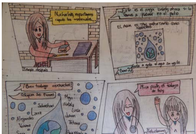
6. Viñeta Realizada por las estudiantes Del Proyecto Construyendo una Imaginación Creativa, Publicidad y fotografía

Por su parte los estudiantes de grado octavo, entienden que no solo comparten con