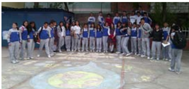
14. Autor: Estudiantes Del Proyecto Construyendo una Imaginación Creativa, Publicidad y fotografía

cuando manifiestan que perciben las actividades artísticas como una forma de expresar sus emociones y de relacionarse con otros compañeros. Así mismo conciben los escenarios lúdicos como espacios donde pueden divertirse y alejarse del estrés que les produce los procesos académicos que tienen tanta relevancia en la institución.