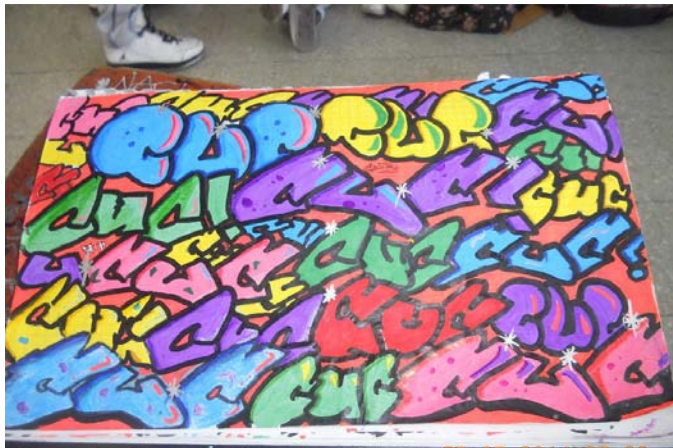
8 Autor: Estudiantes Del Proyecto Diseña tu Manualidad con Estilo

En referencia a la tolerancia, esta es entendida por el autor como “que los diferentes tienen derecho a seguir siendo diferentes y de aprender de sus diferencias” (Freire, Paulo, 1997, p. 126), es decir que no es posible vivir en un mundo homogéneo, pero que vivir en un mundo heterogéneo abre la puerta a la aventura de aprender del otro, que tiene el derecho como yo de ser diferente. Así mismo esta concepción de tolerancia no niega la emergencia de los conflictos, causados por la diferencia, ni desconoce los antagonismos que puedan surgir de la dialéctica de