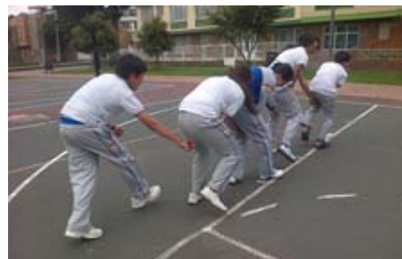
18. Autor: Estudiantes Del Proyecto Sport and Dance

En este mismo sentido, se puede afirmar que la experiencia artística, es un elemento motivador para el auto reconocimiento en los estudiantes y la valoración de los demás, como lo expresan diferentes autores como Howard Gardner (2012),