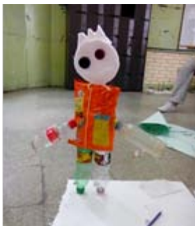
4. Autor: Estudiantes Del Proyecto Diseña tu Manualidad con Estilo

“El hecho de asignarle la meta a un estudiante cualquiera de enseñar este nuevo modo de vida y retarlo a cautivar a otro estudiante en iguales condiciones y cambiarle los papeles de estudiante a moderador y guía es una experiencia de liderazgo muy sustanciosa y grata” Taller de escritura, grado undécimo