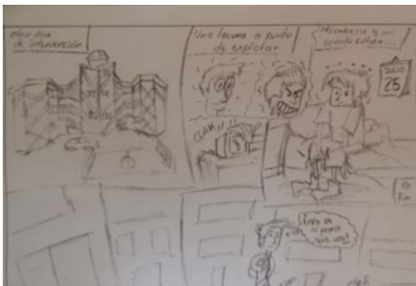
15. Viñeta Realizada por Diego A Ortiz, Proyecto Push Dance

Acerca de las investigaciones realizadas, sobre las diferentes perspectivas, desde las cuales se ha venido abordando el conflicto y la violencia en la escuela, es pertinente anotar que si bien, estas se encuentran realizadas en su gran mayoría por