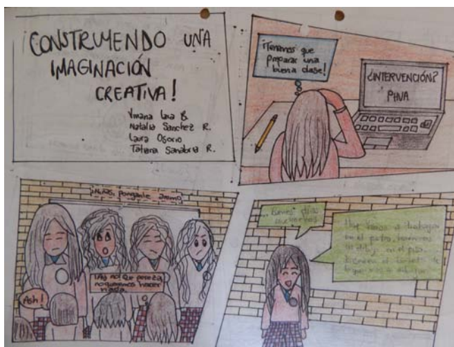
5. Viñeta Realizada por las estudiantes Del Proyecto Construyendo una Imaginación Creativa, Publicidad y fotografía

“A veces en actividades como por ejemplo, tenemos que hacer una publicidad, nos toca trabajar en grupos y nos toca hacernos con los demás, así nos conocemos más. Ósea que sí hacemos más amistades” Grupo Focal, Grado séptimo