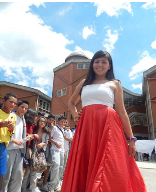
12. Autor Estudiantes Del Proyecto Moda y Creatividad con Estilo

su ejercicio en las jornadas de autogobierno, hasta que pueda ser identificado por los mismos estudiantes en los grados décimo y undécimo. Por tanto el proyecto parte de los talentos de los estudiantes de grado undécimo, quienes los ponen al servicio de la comunidad, sin desconocer los talentos que se puedan presentar en algunos estudiantes de grados menores, ni tampoco el potencial con que cuentan todos los estudiantes de la institución.