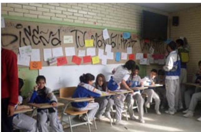
17. Autor: estudiantes Del Proyecto Diseña tu Manualidad Con Estilo

La estrategia TSMC, ha permitido el desarrollo de la reflexión, por parte de todos los miembros de la comunidad educativa, acerca del talento, puesto que este, tiende a ser un concepto excluyente, debido a que implica