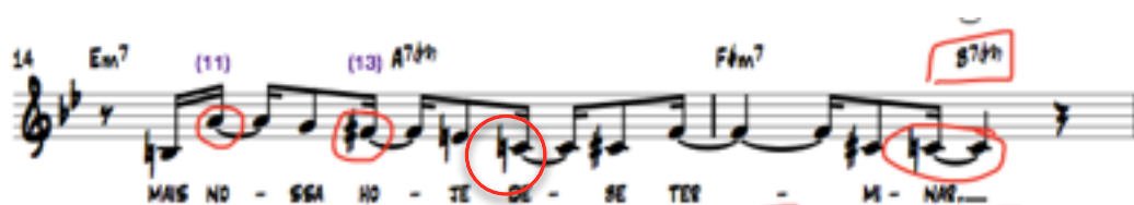
Figura 7: Compases 14 y 15 de ‘En Meu Coração’ por Carolina

No sólo busqué imitar saltos complejos para la voz, sino también el mismo comportamiento de las tensiones melódicas. Por ejemplo en el Anexo 6.1 se encuentra la partitura de Desafinado analizada a nivel melódico y gracias a ese análisis pude construir mi