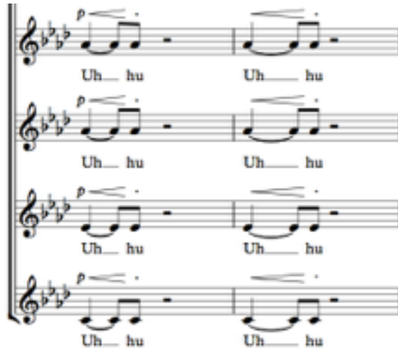
Figura 3 - Célula rítmica: Compases 18 y 19. I Found The Answer , partitura por Carolina Pérez

Además de las voces adicionales, se usará en el formato un piano acompañante con la finalidad de aportar un mood más alegre por medio de la rítmica usada por el pianista, que debe dar un toque de blues conservado del tema original.