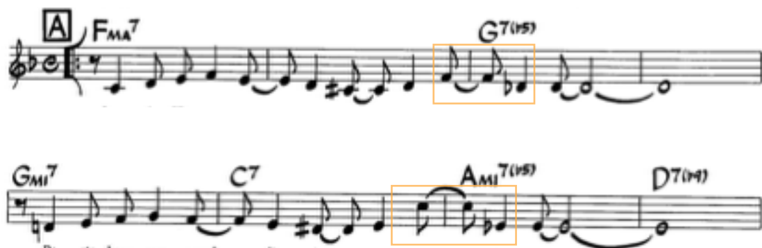
Figura 5: Compases 1-8, Desafinado , Carlos A. Jobim. Intervalo de 4 disminuída y 6ta menor.

Gilberto quien además de ser compositor, hizo de la guitarra acústica su principal instrumento por su libertad interpretativa casi improvisada, muy parecida al jazz (Kirchner, 2000, p. 554). Además del uso de la guitarra y el formato más reducido, otra de las principales características contrastantes con la samba fue la melodía, que en este caso no era tan cantabile sino que contenía intervalos de 4 disminuída o 6ta menor difíciles de interpretar, como por ejemplo en desafinado (ver figura 5).