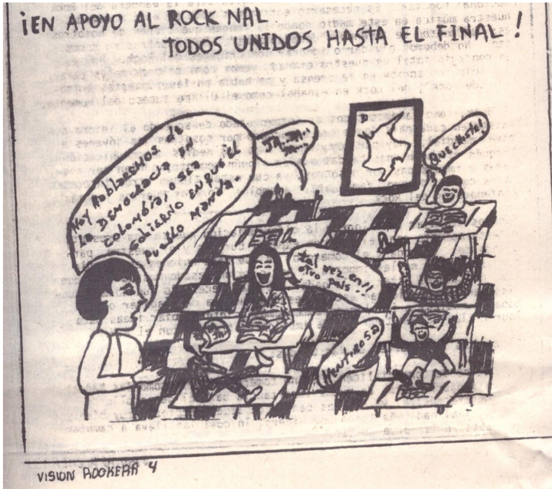
Figura 2. Ilustración Fanzine