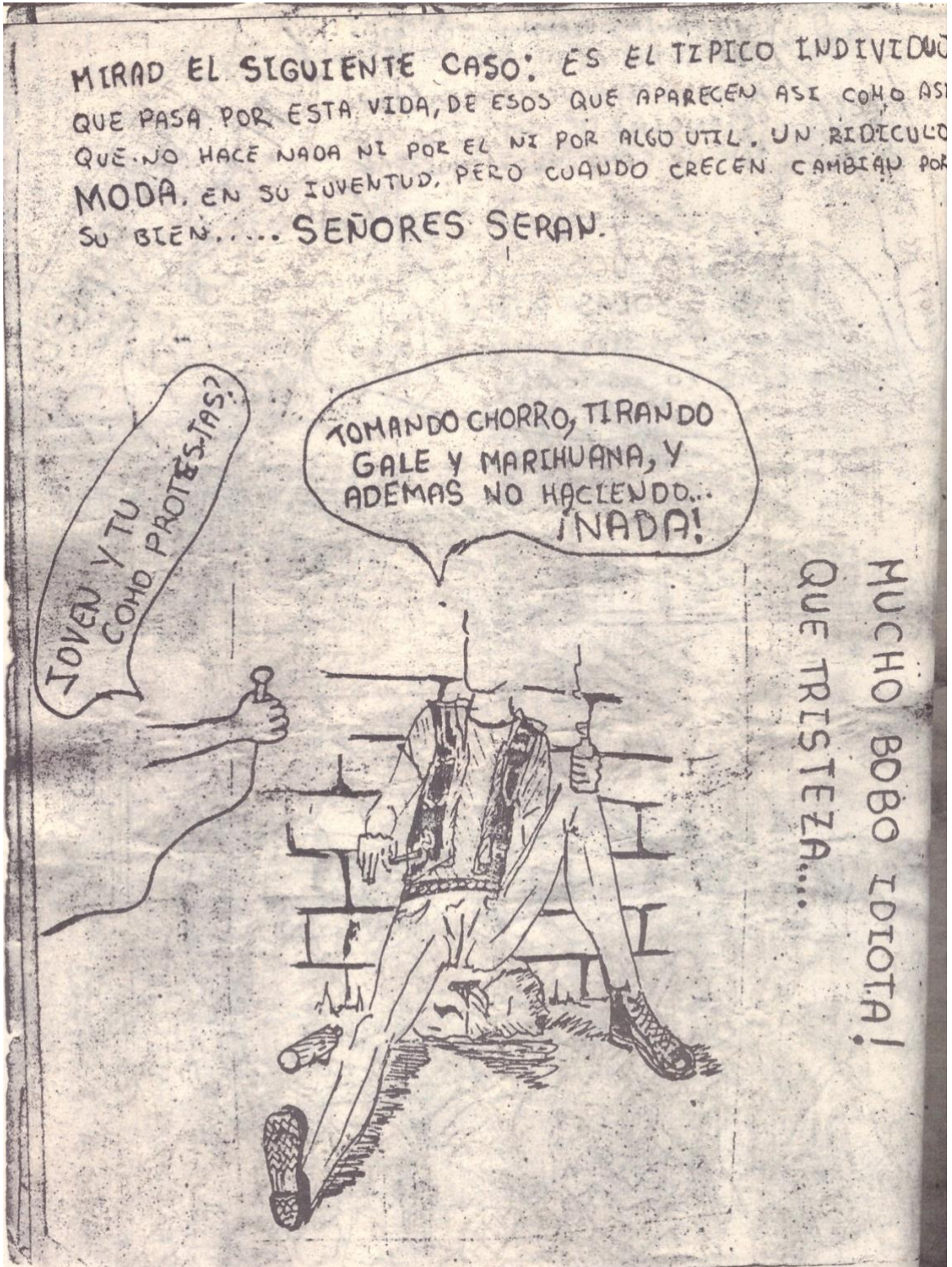
Figura 3. Ilustración Fanzine