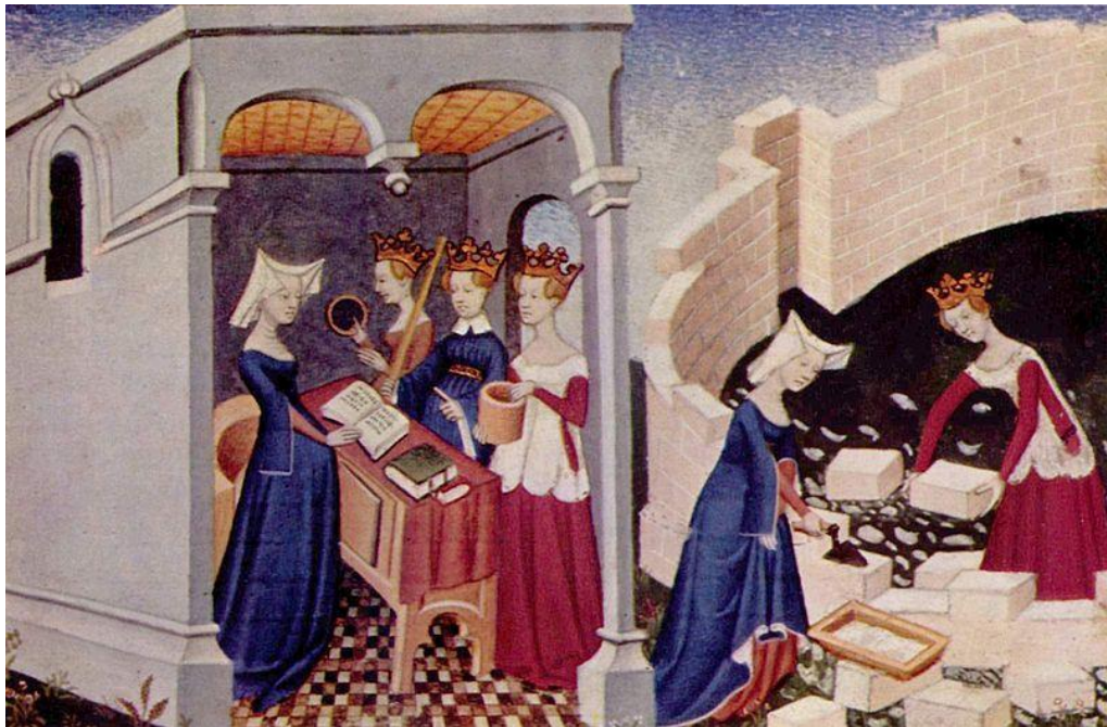
Foto No. 2: Mujeres albañiles construyendo la muralla de la ciudad. (1405) 9 .

Al realizar una revisión bibliográfica sobre la historia del feminismo, nos encontramos que no existe consenso sobre la fecha en que nació y apareció el feminismo como teoría y como movimiento social.