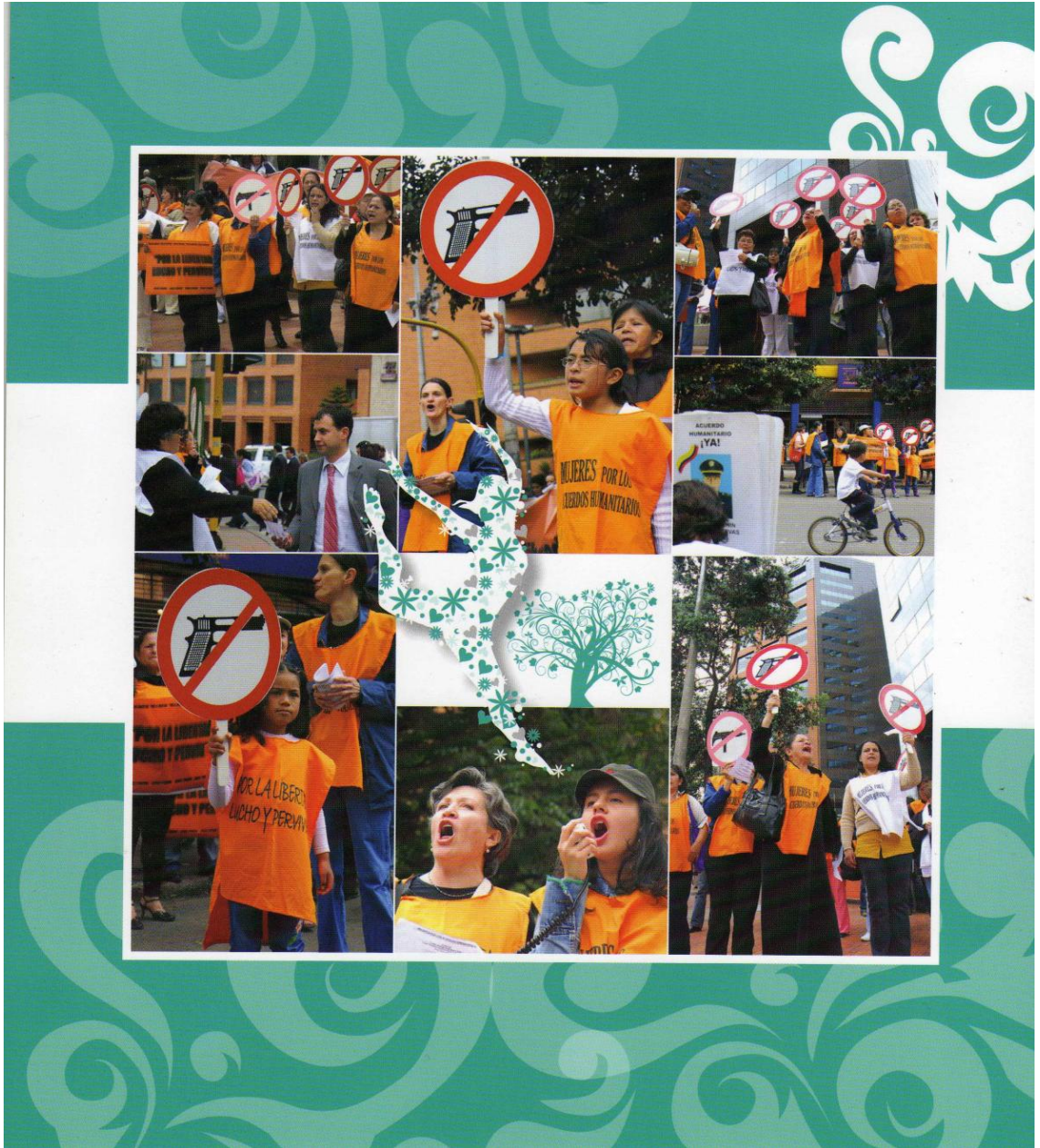
Foto No. 1: Es el momento de la paz y de las mujeres. Ruta pacifica de las mujeres. Boletín institucional. Junio de 2009.