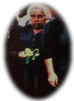
FOTO No 3: portada del libro “las mujeres no parimos hijas e hijos para la guerra” Ruta Pacífica De Las Mujeres. Junio de 2003.

La Ruta Pacífica de las mujeres es un movimiento de mujeres feminista que se moviliza contra la guerra y todas las formas de violencia que afectan a las mujeres y a la población colombiana. Es un movimiento que nace como una expresión de solidaridad y de apoyo a las mujeres que se encuentran en las zonas de conflicto, y como una forma de hacer visible la grave situación de violencia en la que se hallan. La Ruta Pacífica como movimiento, lo conforman mujeres de todos los estratos sociales, profesionales, intelectuales, estudiantes universitarias, de secundaria, campesinas, desplazadas por la violencia, indígenas, incluso hombres que creen en su apuesta política. Pero básicamente está integrada por mujeres organizadas de los sectores populares. (MENDOZA, 2001).