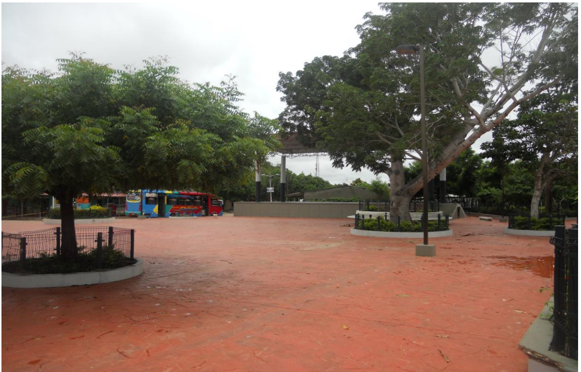
Plaza Son de Negro II

Las últimas fotografías dan cuenta de los cambios en la infraestructura del municipio de Santa Lucía.