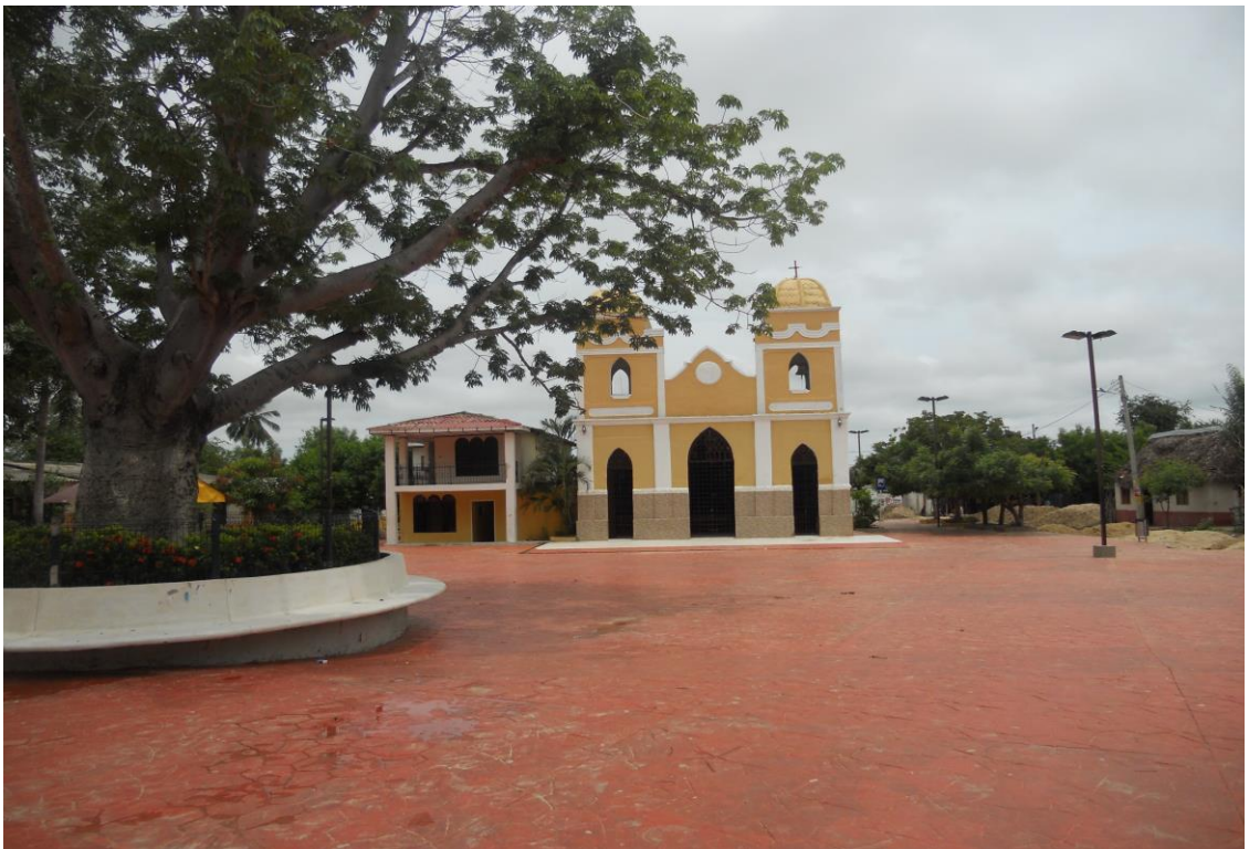
Plaza Son de Negro I