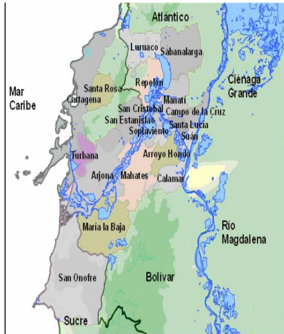
Mapa 2 Subregión del Canal del Dique