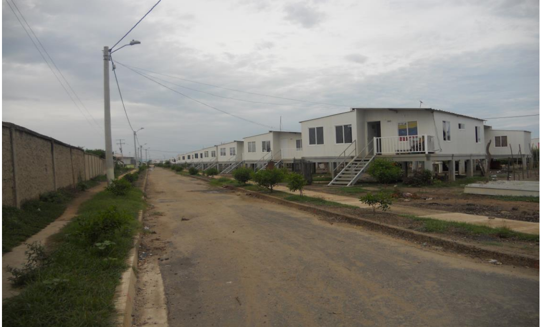
Barrio La Primavera