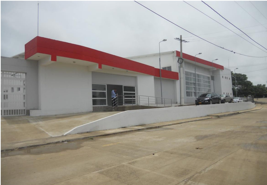
Nuevo centro de salud