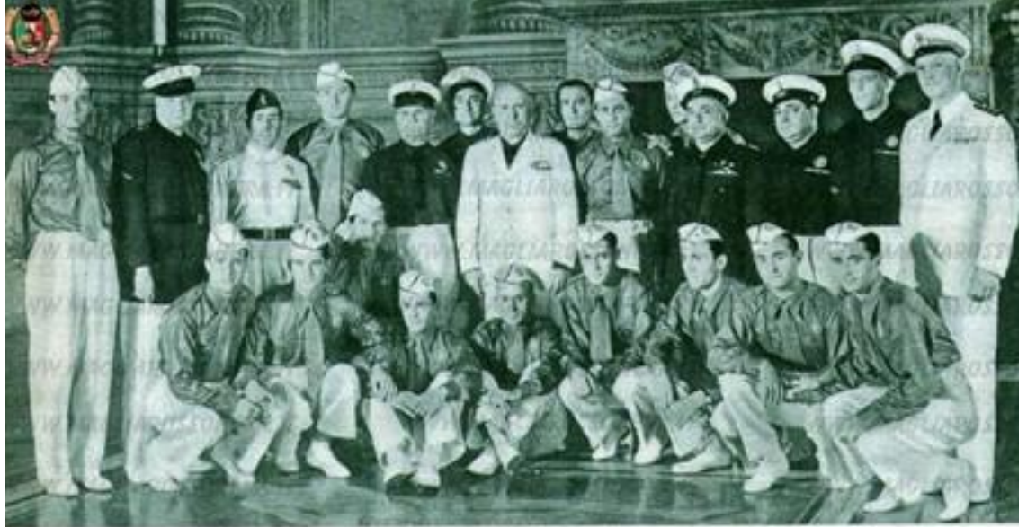
A Palazzo Venezia: in Monzeglio, Meazza, Rav Anexo 11. Prensa Italia Campeón del Mundial de 1934 (II) ...ando, il DUCE, ... Serantoni, Foni,