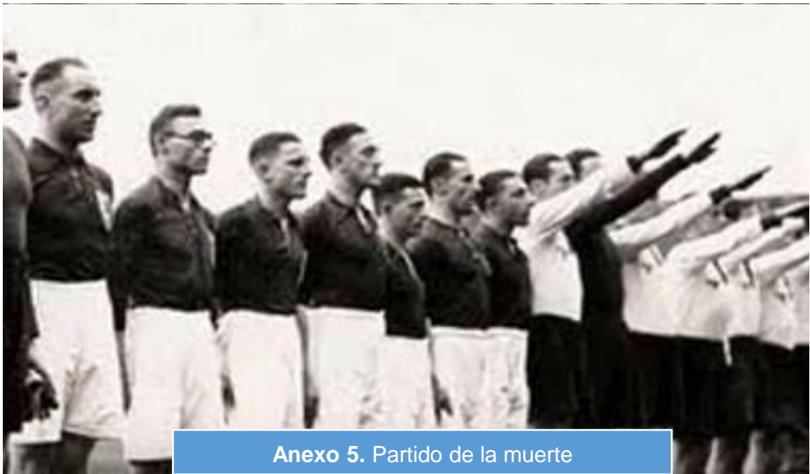
Анехо 5. Partido de la muerte