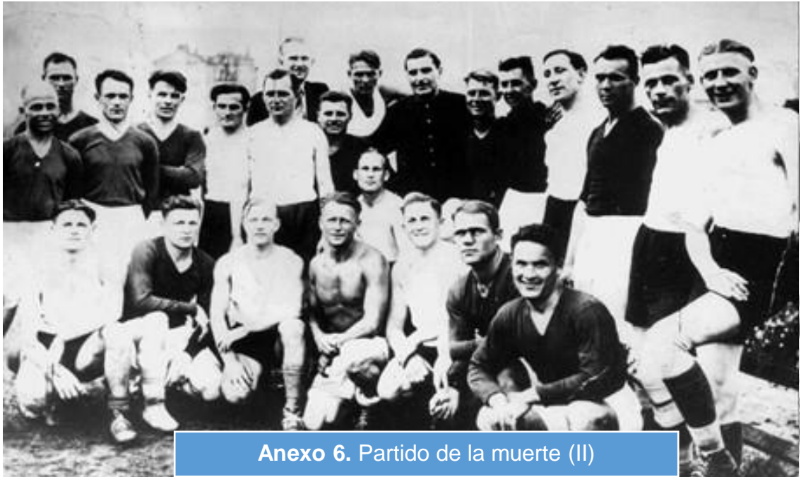
Anexo 6. Partido de la muerte (II)