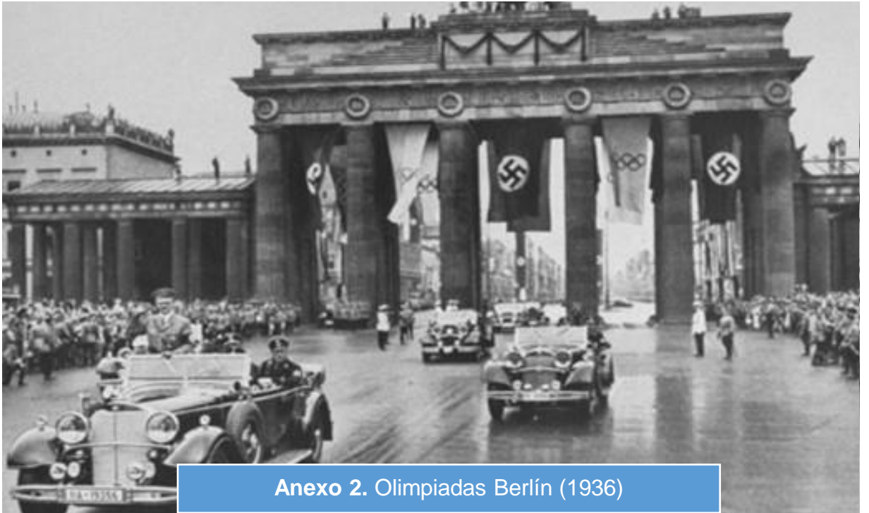
Anexo 2. Olimpiadas Berlín (1936)