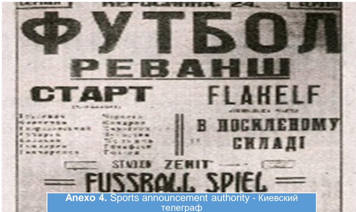
Анехо 4. Sports announcement authority - Киевский телеграф