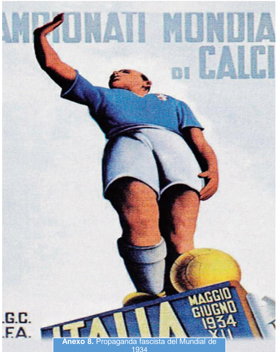
Anexo 8. Propaganda fascista del Mundial de 1934