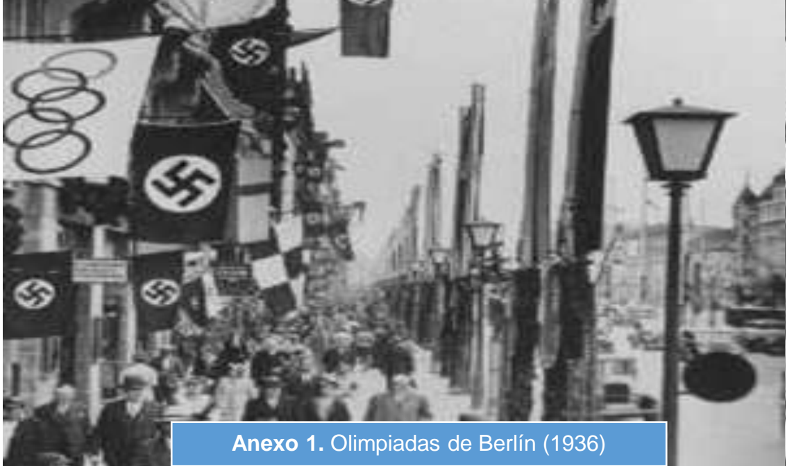
Anexo 1. Olimpiadas de Berlín (1936)