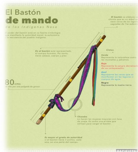
Figura 1. Infografía Juan Ruiz (Pacifista, 2018)

cuales son divisiones de tierra que a cada familia les pertenece para posteriormente trabajar en ella, sin embargo, fueron extinguidas en 1945 (Puerta, 2001, pp 107). El cabildo es elegido anualmente en el mes de diciembre y posesionado en enero, tiene un capitán quien es la primera autoridad; dos alcaldes quienes son los encargados de mantener el orden, administrar justicia y hacer cumplir los dictámenes; dos fiscales quienes defienden los intereses y las intrusiones de la gente foránea; el gobernador es el encargado de las cuestiones religiosas, un secretario y una asamblea (Puertas, 2001). En algunos resguardos los ancianos son los encargados de aconsejar y ejercer autoridad cuando un gobernador no cumple con las reglas establecidas (Ulcue, sf). La máxima autoridad es el gobernador, quien suele identificarse porque lleva un bastón de mando, este está hecho en chonta y le cuelga cintas de colores. Estos colores son: el verde representa la naturaleza; el rojo la sangre derramada; el azul el agua, y el negro a la madre tierra (Márquez, 2018). Este bastón es el que les proporciona autoridad frente a los demás miembros de la comunidad. Para el pueblo representa autoridad moral, autonomía y resistencia.