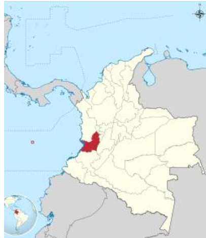
Figura 2. Ubicación Cauca

Tierradentro fue el nombre dado por los españoles pues representaba para ellos, una tierra de difícil acceso para estos colonizadores (Diagnóstico Nasa, sf). Este lugar se encuentra ubicado al sur del país, en la vertiente oriental de la cordillera central y está conformada por dos municipios: Páez e Inzá. (Puertas, 2001, pp: 20) Se dice que debido a que ocuparon este territorio, no padecieron tanto, como otros pueblos indígenas, quizá esta sea la razón por la que hay un gran número de indígenas de esta comunidad en la actualidad.