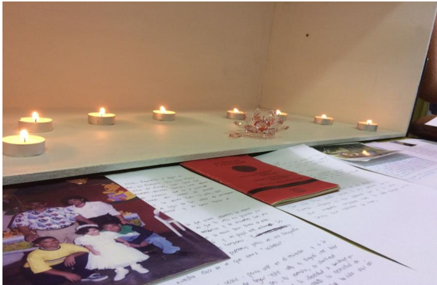
Taller sobre los objetos de la memoria 30 de abril de 2017